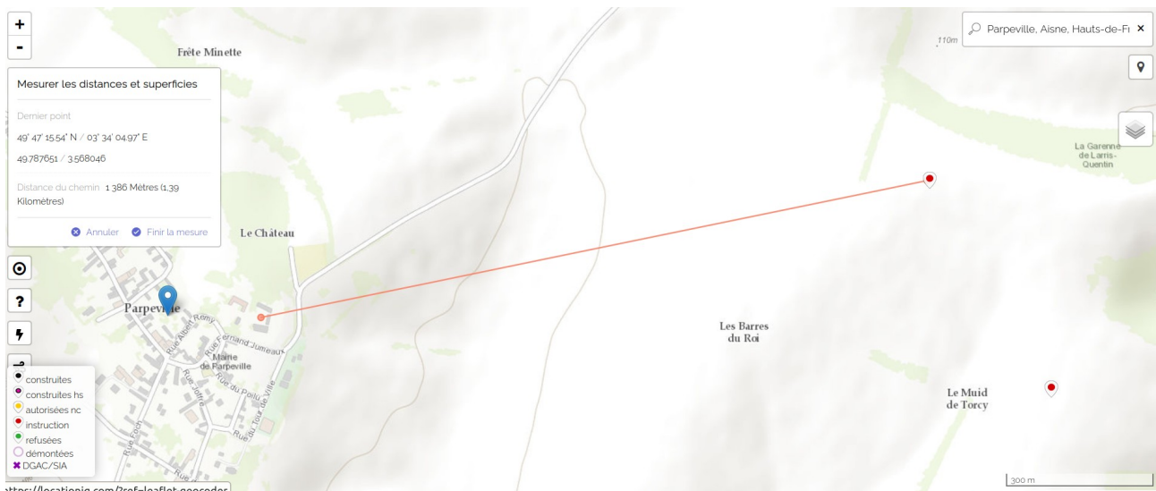
Distance de l'éolienne la plus proche par rapport au château de Parpeville