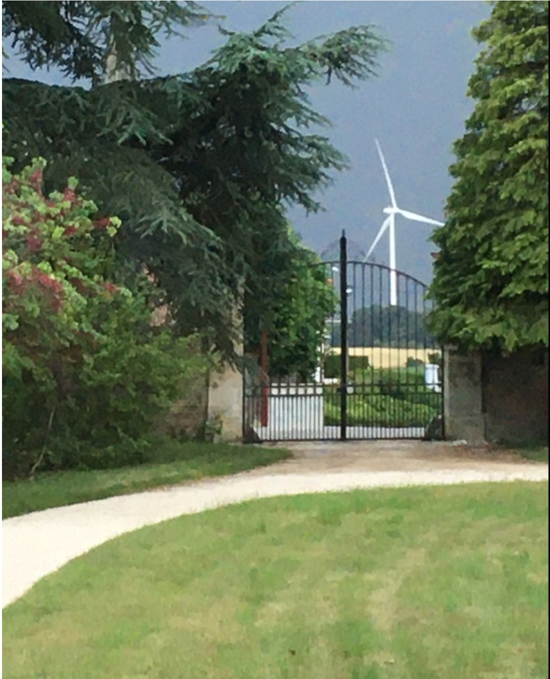
Photo prise depuis le porche du château de l'éolienne T9 installée par le promoteur RES